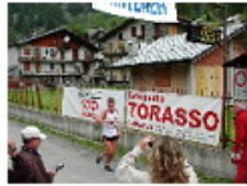
[ 10 ]