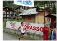
[ 12 ]