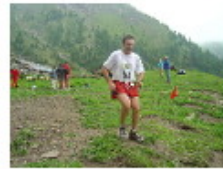
[ 7 ]