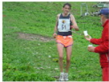
[ 5 ]