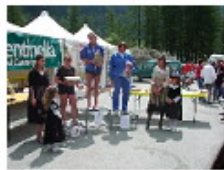
[ 18 ]