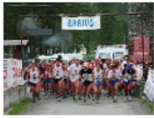
[ 1 ]