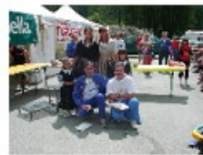
[ 19 ]