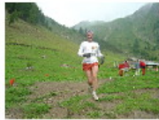
[ 6 ]