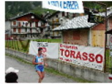
[ 11 ]