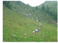
[ 4 ]