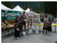
[ 17 ]