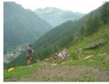
[ 2 ]