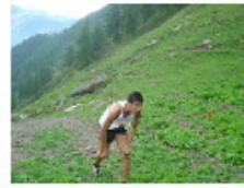
[ 3 ]