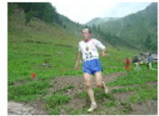
[ 8 ]